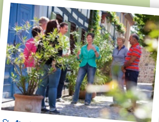
Stadtführung im historischen Stadtkern

Termine: ganzjährig dienstags 14 Uhr, Mai–Oktober auch samstags 10.30 Uhr, für Gruppen auch Termine nach Vereinbarung, www.templin.de Tel. 03987 2631