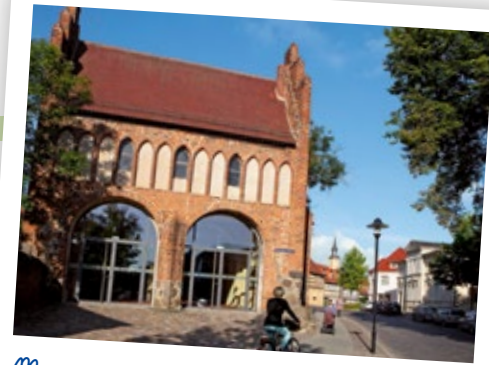
Museum für Stadtgeschichte

www.museum-templin.de , Tel. 03987 2000526