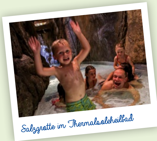
Salzgrotte im Thermalsoleheilbad

In der NaturThermeTemplin erwarten die Besucher Bade- und Saunalandschaften sowie ein attraktiver Wellnessbereich. Die Thermalsole wird aus einer Tiefe von 1.650 Metern gewonnen, wobei sie eine Temperatur von 57,7 Grad und einen Salzgehalt von 15 Prozent aufweist. Die Salzkonzentrationen der Sole bei der Verwendung im Bad und in der Therapie betragen von einem bis sechs Prozent bei Temperaturen von 32 bis 36 Grad. Die aufbereitete Thermalsole wird als ortsgebundenes Heilmittel für therapeutische Zwecke ausschließlich in der NaturTherme-Templin eingesetzt.